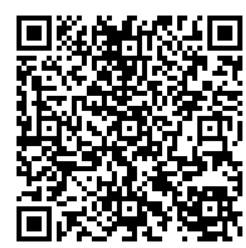
數學練習簡介短片